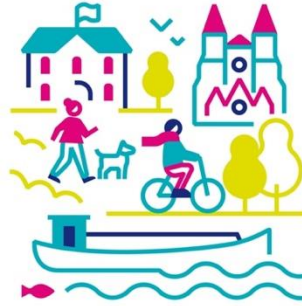
Scénario 2 La Métropole de l'attractivité