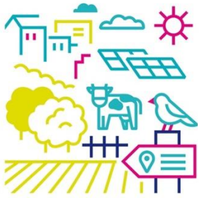
Scénario 1 La Métropole des proximités