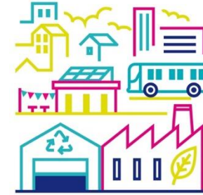
Scénario 3 La Métropole des innovations