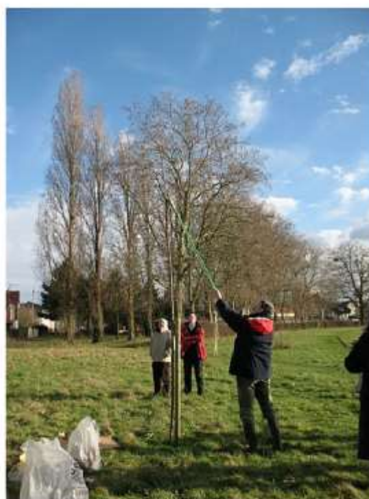
Démonstration de taille