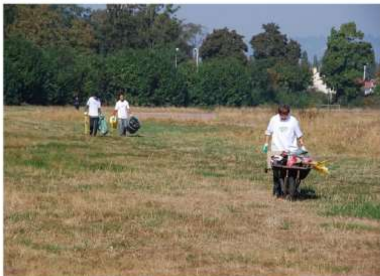
Nettoyage en septembre 2009

Labels : mois de l'économie sociale et solidaire, semaine de la solidarité internationale, semaine européenne de la réduction des déchets.