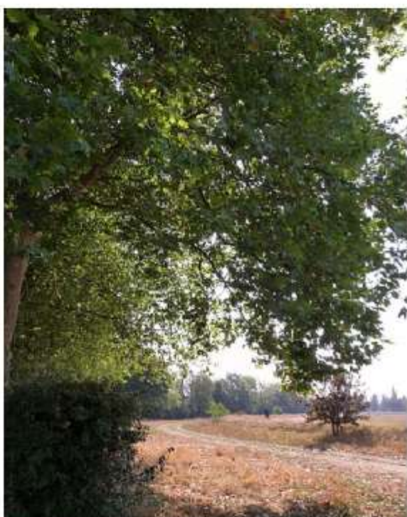
Un lieu pour la biodiversité

Le Parc est source d'une pépinière d'expériences.