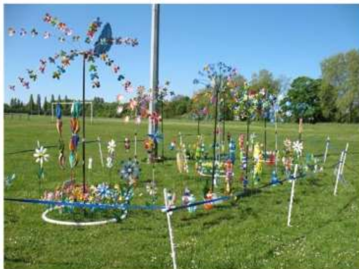
Le Jardin d'Eole, fête de la nature 2012