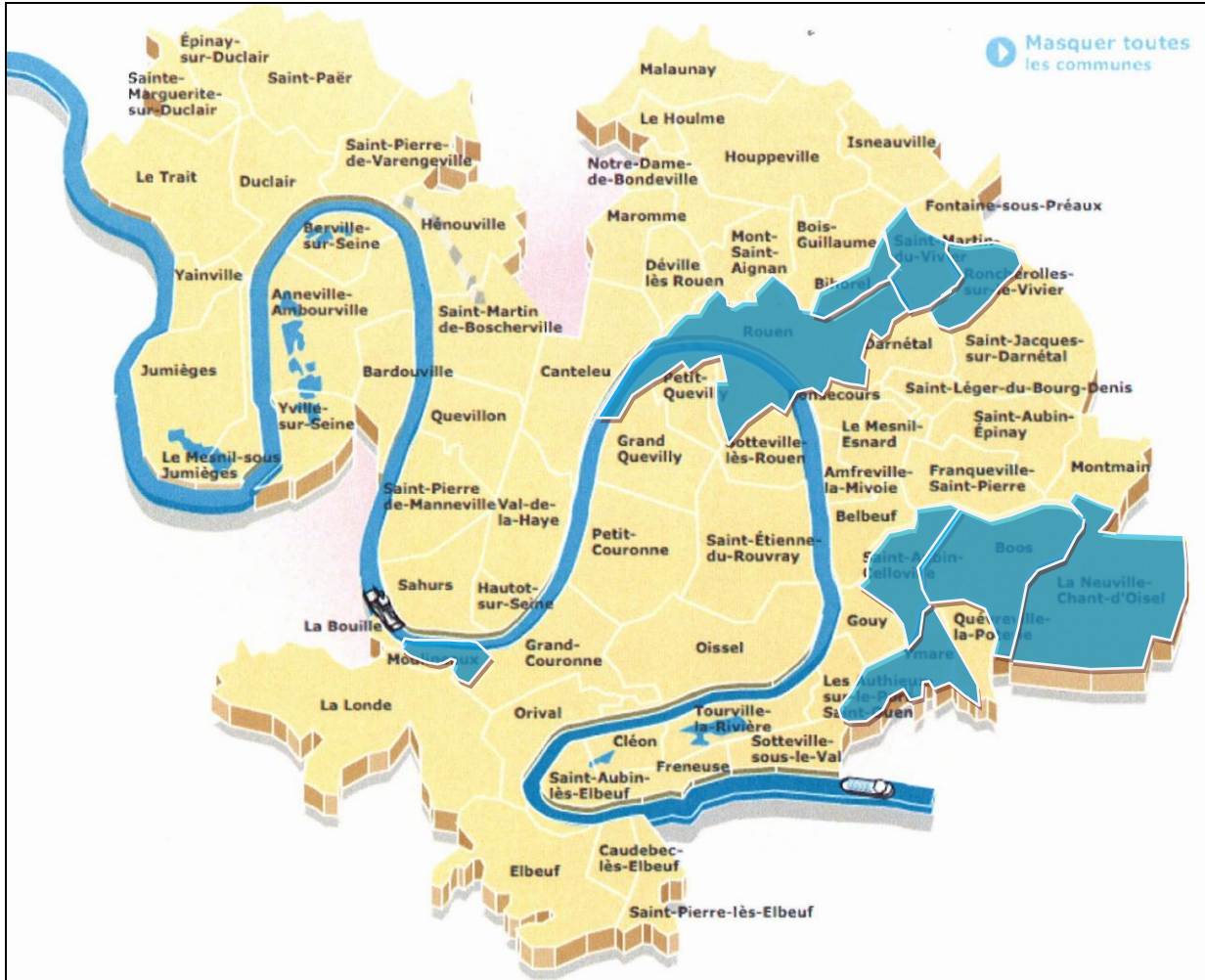
Figure 1 : Communes devant faire l'objet d'un zonage ou d'une mise à jour di zonage d'assainissement eaux usées