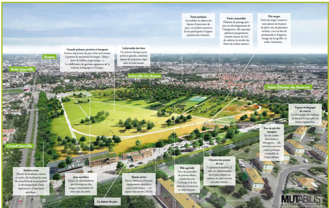
Les différents espaces du futur parc du champ des Bruyères

Des espaces de grandes pelouses parsemés de bosquets laisseront place à des usages libres ( jeux de ballon, pique-nique... ). Ces espaces seront encadrés par des prairies sauvages, fleuries ou pâturées. Des jardins creux viendront recueillir les eaux de pluie, apportant un milieu plus humide comprenant une mare.