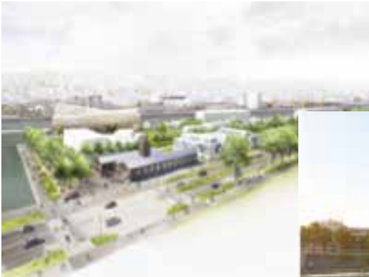
Des quais réaménagés