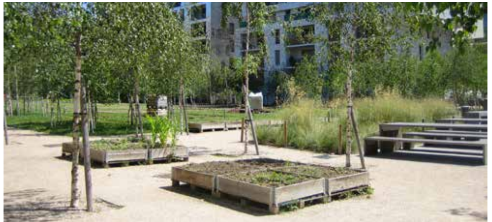
Des logements protégés, disposant tous d'espaces extérieurs