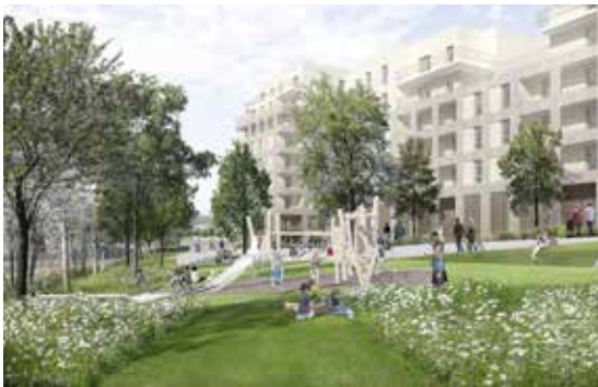
Des parcs et promenades à l'abri de la circulation