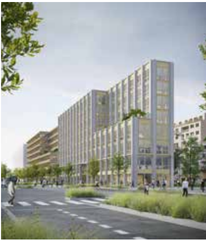
Des bureaux le long des axes structurants