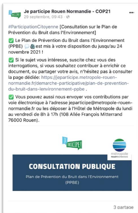
Publication Facebook du 29/10/2021

Cette consultation a été diffusée à près de 3000 personnes inscrites à la newsletter de la participation citoyenne le 7 septembre 2021, puis sur la page Facebook « Jeparticipe » de la Métropole et a fait l'objet d'une publication légale, dans le Paris Normandie , 15 jours avant son début (le 6 novembre 2021).