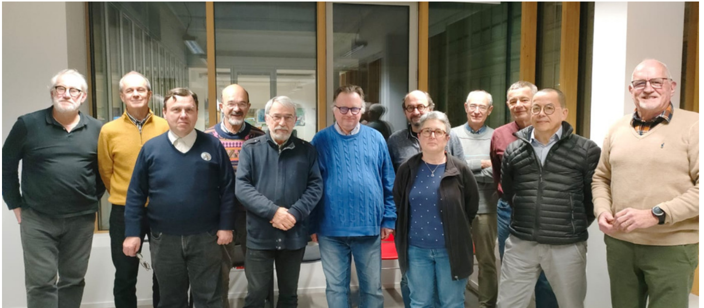
Participants à la session du 25 janvier 2024