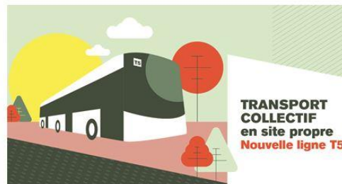
Figure 5 Invitation ateliers participatifs 22/03/2022

👉 Inscription ici : https://bit.ly/3JJO68I