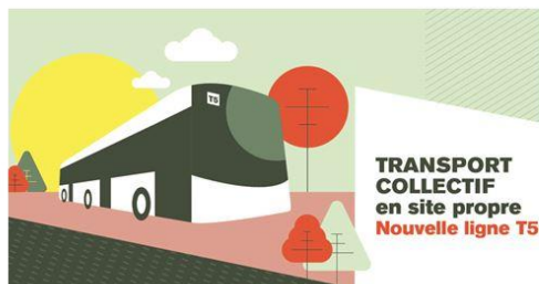
Figure 3 Invitation courriel balades urbaines 31/01/2022

N'hésitez pas à diffuser l'information autour de vous !